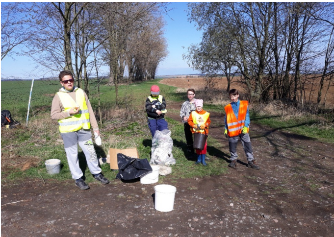
Uklidme Česko 2019; foto: Mladí hasiči 3x

Prosím o předběžné potvrzení účasti do středy 29. 3. 2023 (objednání občerstvení po úklidu).