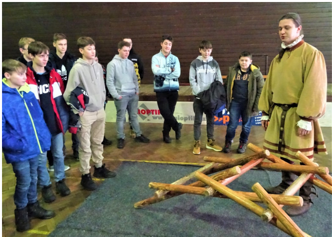
Výklad o samonosném mostě