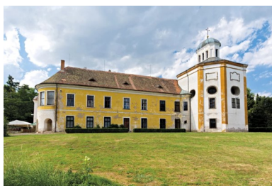
Raně barokní zámek v Cholticích

Lázně Bohdaneč je další sídlo, kam zavítáme. Ve 14. století patřilo město klášteru v Opatovicích nad Labem, později se rozvíjelo rybníkářství. V okolí Bohdaneče je rybníkářská oblast s mnoha rybníky. Uvedu ty největší – Bohdanečský, Pohránovský, Sopročský, Rozhrna, Buňkov a Trhoňka. Některé jsou napájeny z Opatovického kanálu. Roku 1896 se začaly stavět rašelinné a uhlíkové lázně. Hlavní budovy byly postaveny v letech 1911–1913 podle návrhu věhlasného stavitele J. Gočára. V lázeňském parku vyvěrá z hloubky 347,5 m artéský pramen. V lázních se léčí revmatismus, pooperační stavy po ortopedických zákrocích a cévní choroby. Dominantní památkou je barokní kostel sv. Máří Magdalény, který postavil proslulý stavitel T. Haffenecker v letech 1728–1737. v interiéru vyniká hodnotná pozdně gotická monstrance z roku 1527 a nádherný oltářní obraz od J. Kramolína. Na náměstí je původně renesanční radnice s podloubím ze 16. století, upravená barokně v roce 1722. V centru města se dochovaly renesanční domy s pěknými barokními fasádami.