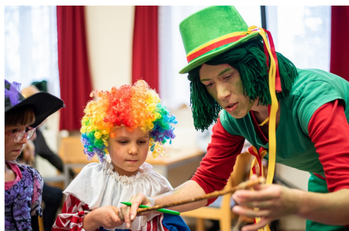
Více fotografií naleznete na www.sebranice.cz ve fotogalerii