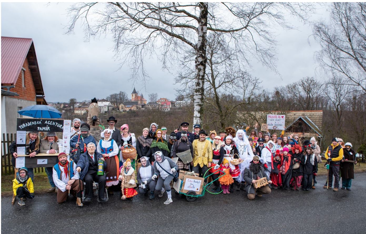
Foto: M. Čermák 4x; Více fotografií naleznete na www.sebranice.cz ve fotogalerii