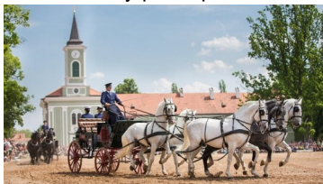
Kladrubští bělouši na vyjíždě s kočárem

Mimořádně významné sídlo, které si prohlédneme, jsou Kladruhy nad Labem. První jsou zmiňovány roku 1352, kdy ves byla vladyckým sídlem. Již na počátku 16. století zde Pernštejnové založili oboru a ves připojili k pardubickému panství. Tradice chovu koní, speciálně vyšlechtěných pro slavnostní spřežení, se v Kladruzech udržuje více než 400 let. Zdejší hřebčín povýšil roku 1579 císař Rudolf II. na císařský ústav. Předchůdci dnešních běloušů přišli ze španělské Andalusie. Za nejslavnější z hřebců jsou považováni Generale – narozený 1787 a jeho syn Generalissimus, od nichž je vedena plemenná kniha. Od roku 2002 má zdejší chov statut národní kulturní památky. Chlubí se rovněž titulem – dvorní dodavatel spřežení Dánské koruny. Kdo miluje koně, určitě se vypraví do hřebčína umístěného v anglickém parku a obklopeného pastvinami protnutými starými alejemi. Zdejší klabonosí bělouši jsou dodnes zapřaháni do královských kočárů. Zajímavostí je, že hříbata se rodí tmavá. Lze si zaplatit projížďku po okolí v kočáře. Konají se tady nejruznější jezdecké závody. A umí zde hrát i pushball, což je koňský fotbal s koženým míčem o průměru 1,6 metru.