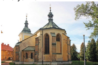
Barokní kostel sv. Jakuba Většího