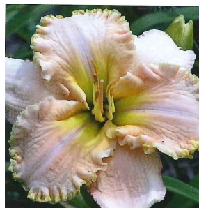
All The Magic