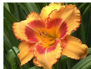
All Fired Up