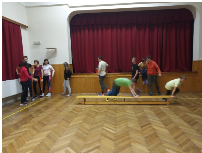
Trénink na sále KD; foto: SDH Sebranice 6x