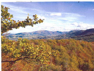
Celkový pohled na Jizerskohorské bučiny

Bučiny Jizerských hor jsou zároveň národní přírodní rezervací. Rezervaci tvoří největší komplex souvislého bukového lesa u nás. Pásmo bučin se táhne ve vrcholové části hor od Špičáku (723 m) k východu do zářezu smědovské silnice a odtud na sever přes Paličnick (843 m) a Tišinu (872 m) ke Křížovému buku. Bučiny zahrnují nejhodnotnější porosty