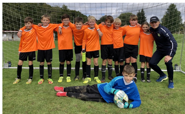
Turnaj v Březové