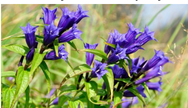
Hořec tolitovitý

Jizerských hor a jsou lokalitou nadregionálního významu. Proto se jim dostává podpory ze zahraničí přes realizaci Projektu záchrany ohrožených dřevin v Jizerských horách. V bukovém lese roste i bohatá květena, zahrnující lesní podhorské druhy, druhy horské až subalpínské, na chráněných místech druhy teplomilné. Potkáme zde měsíčníci vytrvalou, hořec tolitovitý, kokořík vonný, jaterník podléšku, plicník lékařský, černýš hajní, sadec konopáč, koniklec luční, kyhanku sivolistou, hvozdk píšečný, prstnatec bezový, šafrán bělokvetý, kosatec sibiřský, hlavinku horskou, kýchavici bílou, devětsil lékařský, vachtu trojlistou, hořec tečkovaný, ocún jesenní, lýkovec jedovatý, kalinu obecnou a desítky dalších druhů rostlin. Vzhledem k tomu, že Jizerské hory tvoří téměř beze zbytku krkonošská žula, můžeme tu vidět žulová skaliska, balvany nebo sutě. Přestože národní rezervace tvoří celek, jednotlivé úseky mají zčásti odlišnou podobu.