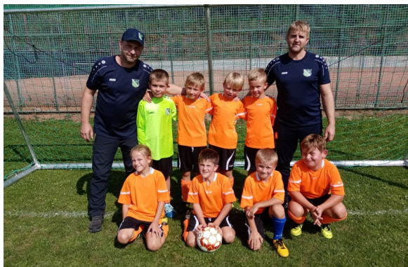
Turnaj v Jaroměřicích