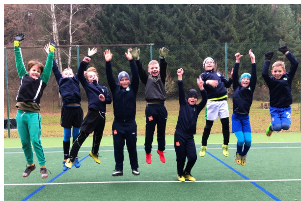
Radost po tréninku