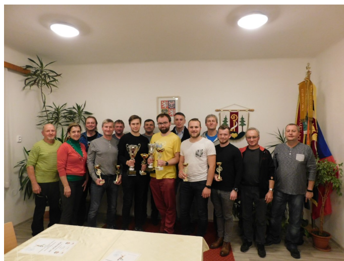
Foto z vyhlášení dne 19. 11. 2021