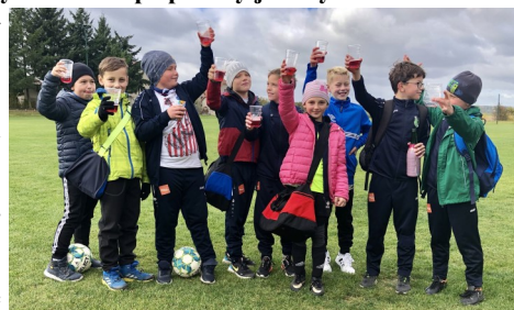
Turnaj v Morašicích

Loňská sezóna byla téměř celá poznamenaná koronavirem, a tak jsme se všichni těšili na start soutěžního ročníku 2021/2022, až si po dlouhé odmlce konečně zahrajeme fotbalový zápas. Velice pečlivě jsme se na podzimní turnaje připravovali.