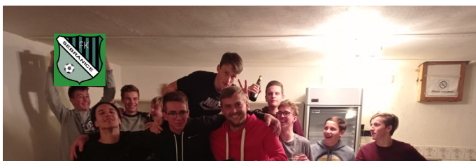
Zakončení fotbalové sezóny