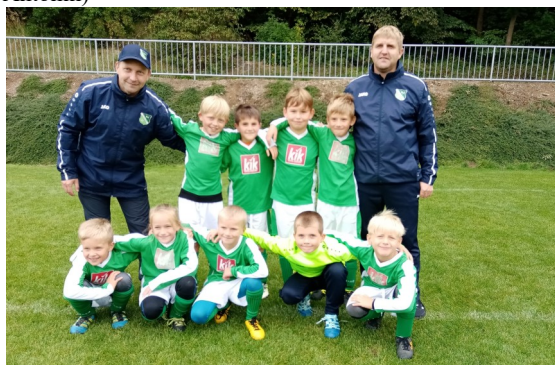
Turnaj v Čisté