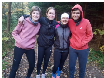
Dorost – 4 stateční

Dorost měl závod běžet vůbec poprvé, musel se tedy, na rozdíl od mladších a starších žáků, naučit nové disciplíny. Například přeskok přes vodní příkop, šplh po laně, střelba ze vzduchovky, zdravotvěda a hlavně celou trať se orientovat pomocí azimutu. Starší žáci se tohoto závodu účastnili už vícekrát, na závod tedy spíš jen opakovali. U mladších žáků máme nováčky, ti se tedy také museli vše naučit nově. Ale připravovali se s nadšením, moc jim to šlo a na závod se těšili.