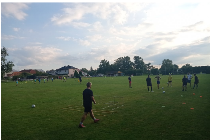
Hráči při tréninku