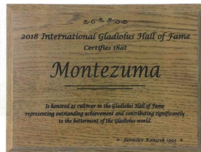
Odrůda MONTEZUMA uvedena do síně slávy NAGC