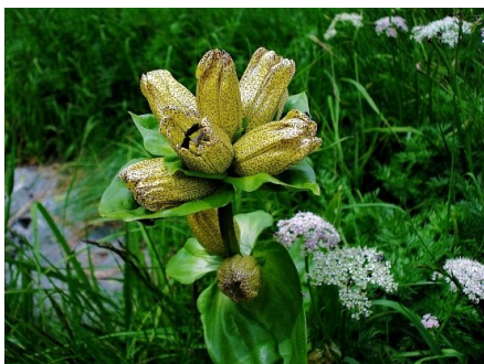
Hořec tečkovaný