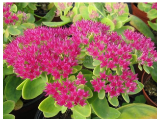
Rozchodníky (lat. Sedum )

... a v říjnu nás provázely především tyto květy: