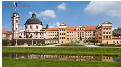
Zámecký komplex s kostelem sv. Markéty v Jaroměřicích nad Rokytnou

Při putování Podhoráckem nesmíme zapomenout zavítat do Jaroměřic nad Rokytnou. Původně tržní ves s tvrzí je poprvé zmiňovaná v polovině 13. století, později městečko městská práva získalo až v roce 1859. Městu dominuje jeden z největších zámeckých komplexů v Evropě. Na místě tvrze byla v 2. polovině 16. století vystavěna renesanční budova, která později získala barokní podobu. Pro rod Questenberků navrhl rozsáhlý zámek rakouský architekt J. Prandtauer, impozantní štuková výzdoba je dílem G. Alfieriho a J. Canonioho. Největší rozkvět zaznamenaly Jaroměřice za Jana Adama z Questenberka (1678–1752). V zámku se konala premiéra opery Františka Václava Míči O původu Jaroměřic (1720). Na západní straně navazuje na zámek monumentální farní i zámecký kostel sv. Markéty s velkou kopulí a dvěma věžemi. Pod zámkem je malebný anglický park.