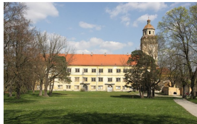
Zámek v Moravském Krumlově, kde byla vystavována Slovanská epopej

Dalším sídlem, které na Podhorácku navštívíme, je Moravský Krumlov. První historická zmínka uvádí rok 1277, v držení Krumlova se vystřídala řada šlechtických rodů, poslední byli Lichtenštejnové. Hlavní dominantou města je zámek, jeho křídla se obracejí do nádvoří třemi patry arkád na toskánských, ionských a korintských sloupech, arkády 1. patra zdobí kartuše s aliančními erby majitelů.