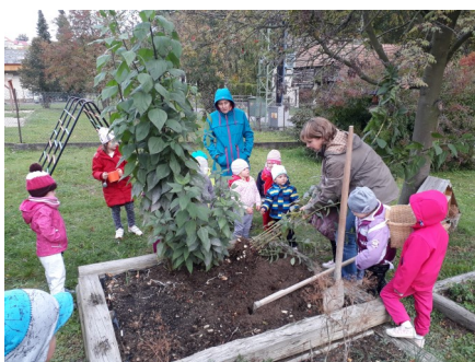
Sklízíme úrodu z naší školkové zahrádky