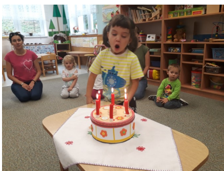
Naši podzimní oslavenci