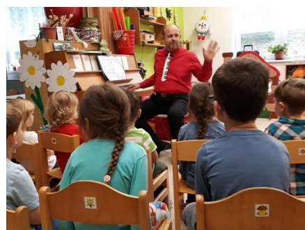
Hudební návštěva pana Kubáta, tentokrát na téma Antonín Dvořák