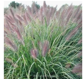
Dochan psárkovitý, neboli vousatec (lat. Pennisetum alopecuroides ) Zdroj: ceskerostliny.cz