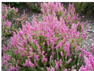
Vřes obecný (lat. Calluna vulgaris )