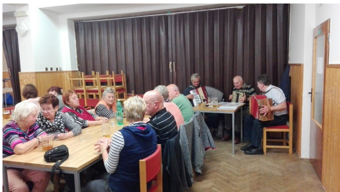
Pohled do přísáli...