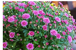
Chryzantémy (lat. Chrysanthemum )