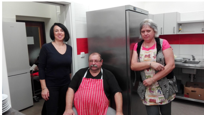
... a do kuchyně; foto: J. Vomočilová 2x