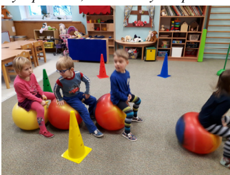
Cvičíme, učíme se a hrajeme si.