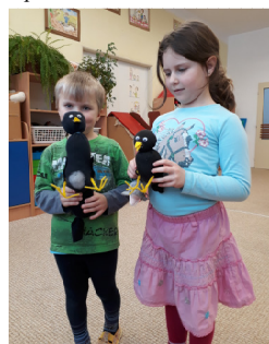
Velkým lednovým tématem byli Ptáci v zimě... Děti si vyrobily krmítka, ptáčky z ponožek, ... A naučily se spoustu nových věcí.