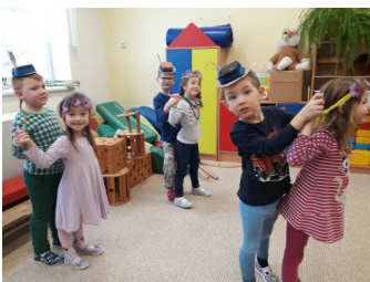
Plesová sezóna ve školce

Leden i únor utekl jak voda a už budeme pomalu vítat jaro... O tom, jak nám ve školce plyne čas při různých činnostech vypovídají nejlépe následující fotografie: