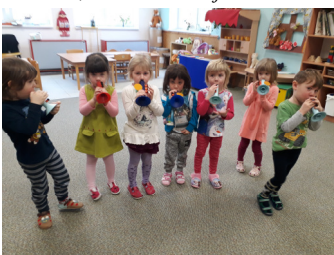
Jede, jede poštovský panáček...