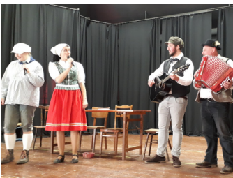
Letošní školkový karneval na téma Lidová písnička se opět vyvedl... Děkuji všem maminkám, které si dají práci s vymýšlením kostýmu a celému kolektivu MŠ a rodinným příslušníkům za pomoc při přípravách a organizaci akce.