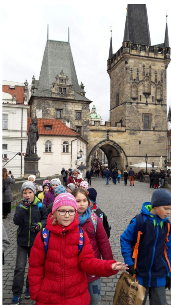
Na Karlově mostě