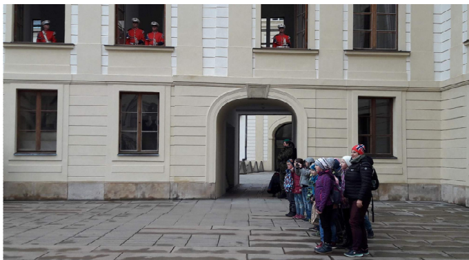
My na I. nádvoří a muzikanti

Ve 12 hodin žáky čekal další nevšední zážitek, střídání stráží na I. nádvoří Pražského hradu, několik metrů od hradních stráží, kam se dostali jen na zvláštní povolení. Děje se tak za doprovodu kapely v červených uniformách z oken Pražského hradu.