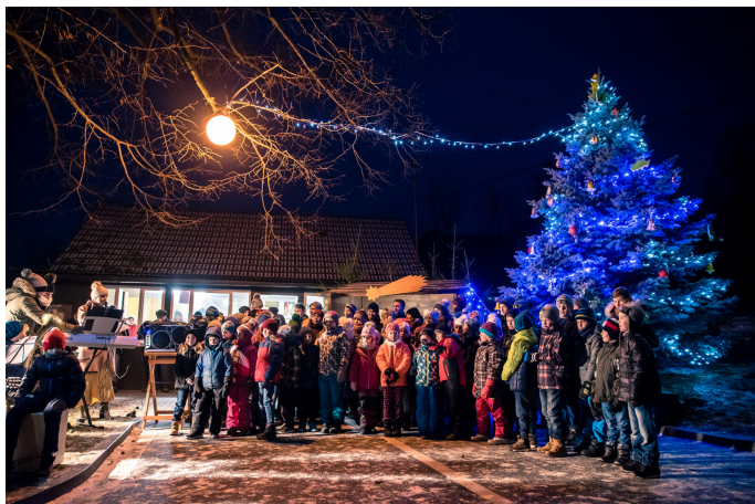
Slavnostní rozsvícení vánočního stromu 2. 12. 2018