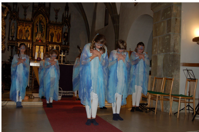
Vánoční koncert ZUŠ Dolní Újezd 16. 12. 2018