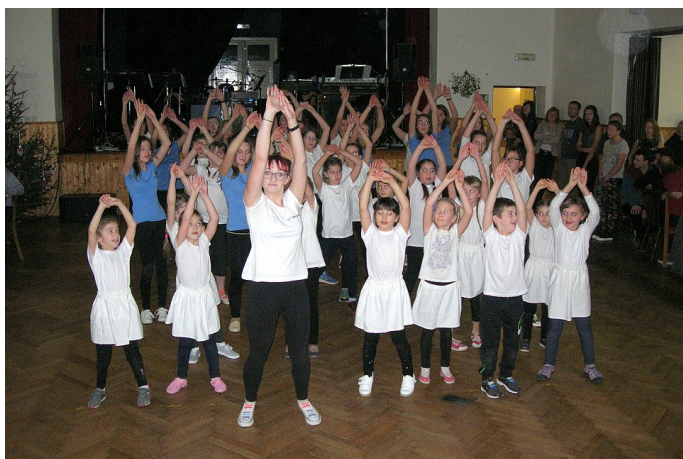
Předsilvestrovské posezení 28. 12. 2018