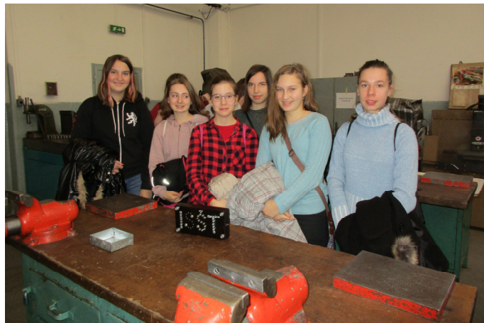
Děvčata po zkompletování krabičky

Ve čtvrtek 29. 11. 2018 navštívili žáci devátého ročníku Integrovanou střední školu technickou Vysoké Mýto. V paměti starších zůstala tato škola spojená s názvem „karosácké učiliště“. Mistři odborného výcviku představili žákům šest oborů, které se na škole vyučují. Výklad byl zpestřen připravenými úkoly. Žáci měli možnost si vyzkoušet stříkání barvou, šroubování, čalounění, psaní v programu, vyklepávání karoserie.