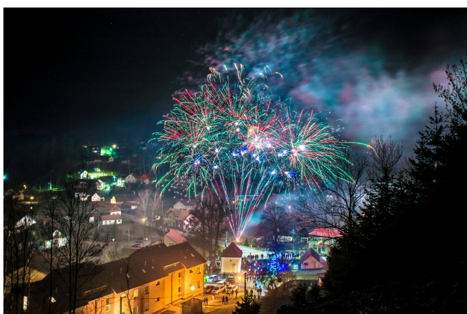
Silvestrovský ohňostroj 31. 12. 2018