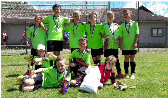
O pohár starších přípravek v Čisté - neděle 11. 6. 2017 a krásné 2. místo