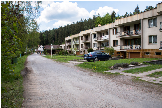
Stav před opravou