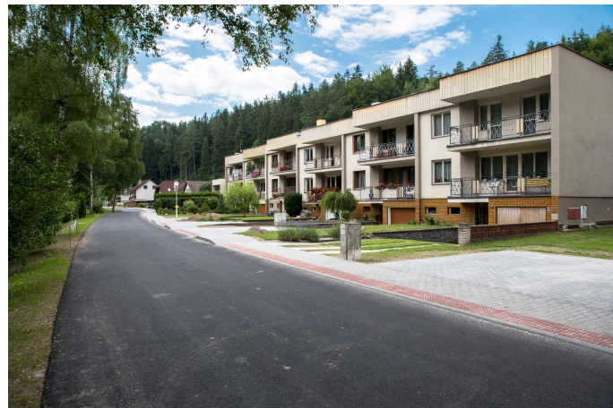
Stav po opravě