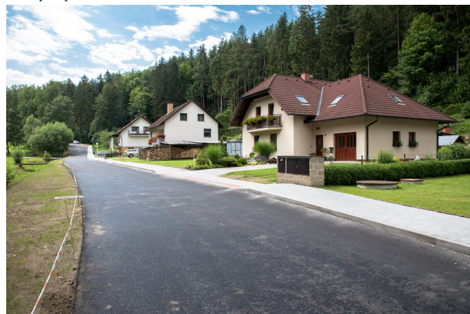
Stav po opravě