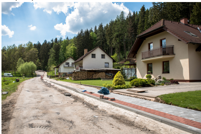
Stav před opravou Foto: M. Čermák 4x