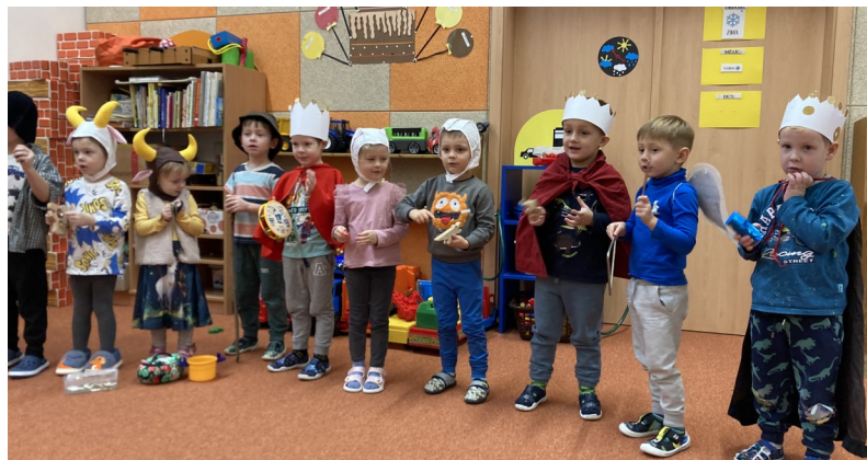
Tři králové nás provázejí, učí nás a ukazují nám cestu