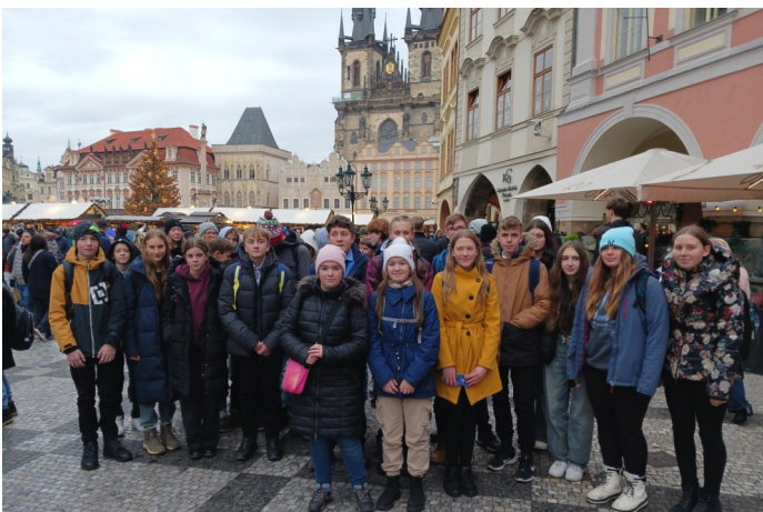
Na Staroměstském náměstí