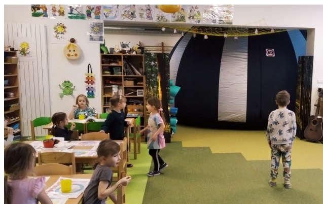
Unikátní zážitek....sférické kino, postavené za 5 minut.....děti nadšené.....můžeme si ho nechat, pani učitelko?