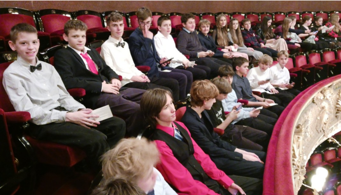
Chlapci v hledišti Národního divadla