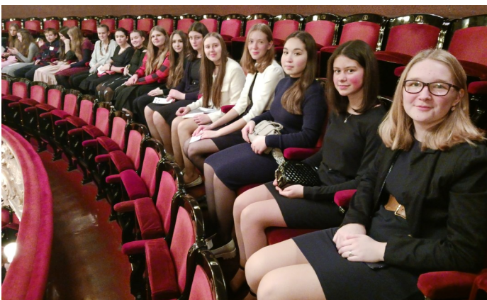
Dívky se těší na představení