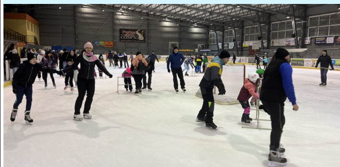
Bruslení na stadionu v Poličce 30. 12. 2024.

Srdečně Vás zveme na bruslení na zimním stadionu v Poličce, které se uskuteční v neděli 19. 01. 2025 od 18 do 19:30 hod. Zájemci o hraní hokeje - hokejky a puky s sebou. Doprava vlastní, vstup všem zdarma.