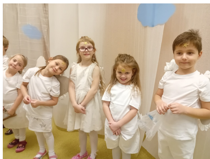
Andělská vánoční besídka

Pro více fotografií navštivte naše webové stránky, tam určitě svého andílka najdete ☺.