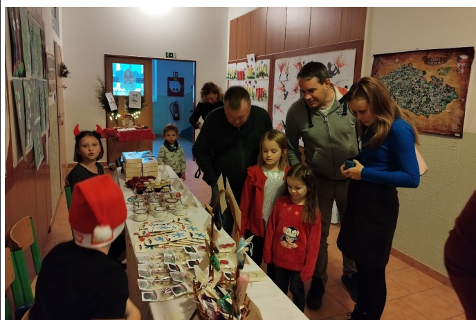
Spokojení návštěvníci z řad rodičů