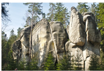
Další pískovcový útvar v Adršpaško-teplických skalách

Teplická jeskyně je nejdelší pseudokrasová jeskyně u nás v Adršpaško – Teplických skalách, o délce 1065 metrů, je blokového typu a tvoří ji souvislý pás dutin pod závalem mohutných skalních bloků, až 10 metrů v průměru a balvanů překrytých suti a hlínami, ležícími na dně hluboce zaříznutého kaňonu Skalního potoka. Pískovcové bloky a balvany vytvářejí stropy, stěny a místy i dno Teplické jeskyně. Síněmi, střídajícími se s těsnými průlezy, plazivkami a puklinovými komíny protéká Skalní potok, na němž se v zimě tvoří ledové zátky a rampouchy, přetrvávající někde až do pozdního léta. Do jeskyně mohou odborníci v několika místech sestoupit mezerami mezi Balvany. Návštěvníkům teplická jeskyně není přístupná.