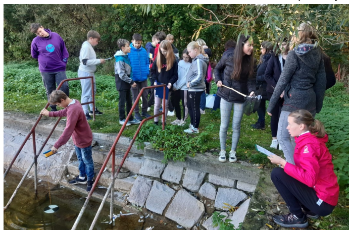
Měření průhlednosti a hloubky vody