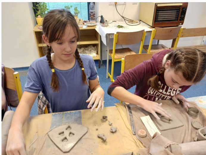
Žákyně 7. třídy vyrábějí vánoční dekorace