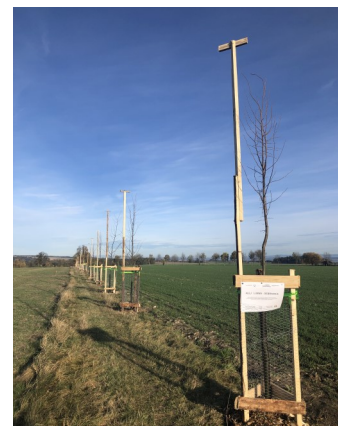
Jablonňová alej k Vysokému lesu