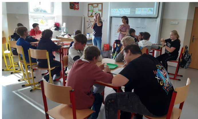
Měření pH vody