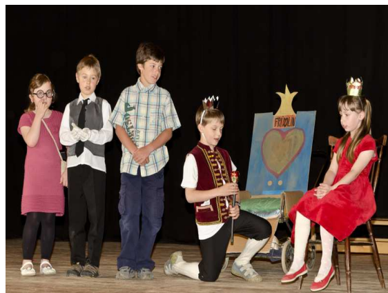
Pohádka v podání žáků 1. stupně ZŠ