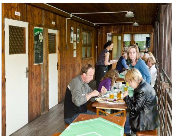
Den první - ochutnávka steakových specialit

Zahájení letního provozu koupaliště začíná již na jaře, kdy je nutné vyčistit bazén a opravit drobné závady, které se po zimě objevily. O vyčištění bazénu se postarali místní hasiči, kteří v sobotu 5. května dorazili na koupaliště s potřebnou technikou.