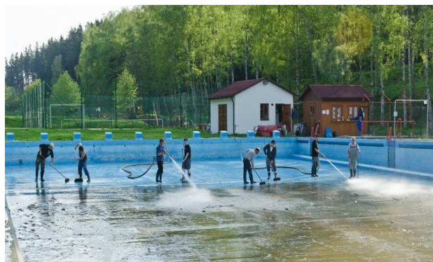
Hasiči při úklidu koupaliště

Ta by sama o sobě byla k ničemu, kdyby se k ní nepřidal pořádný chlpský fortel a síla. Naši hasiči měli všeho dostatek a já jim tímto velmi děkuji za čas, který této akci věnovali.