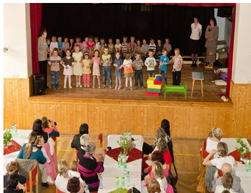
Vystoupení dětí z MŠ

V neděli 6. května se u nás s malým předstihem konala oslava Dne matek. Sál kulturního domu se zaplnil do posledního místa. Maminky a babičky potěšily svým vystoupením děti z mateřské školky, které jim předvedly, jak vypadal jeden den malého Adámka. Nejmenší děti stavěly pec a na ní pak za doprovodu veselých písniček upekly bučky. Všechny byly moc roztomilé a za své vystoupení sklidily velký aplaus. Na závěr některé děti pod vedením paní učitelky Václavy Tmejové zahrály na zobcovou flétnu jarní písničky, které doprovodily zpěvem.