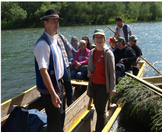
Nasedat a vyplouváme!

V sobotu ráno jsme vyrazili na plť. To jsou jakési novodobé vory. Nesmíte si je ale představovat tak, jak je známe z našich